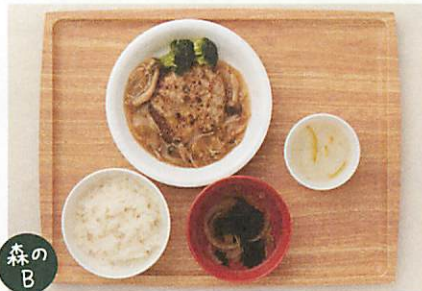
森のB 森のキッチン特製ハンバーグランチ 650yen

つなぎにお豆腐を使用し、毎朝キッチンで心を込めてつくるヘルシー手ごねハンバーグです。食べ応えもあり、身体にやさしいランチです。