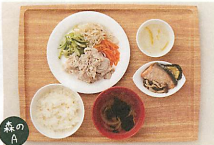
森のA 栄養士のバランスランチ 650yen

森のキッチンのスペシャルランチです。お肉とお魚がコラボしたヘルシーでおいしいよくばり日替わりランチです。