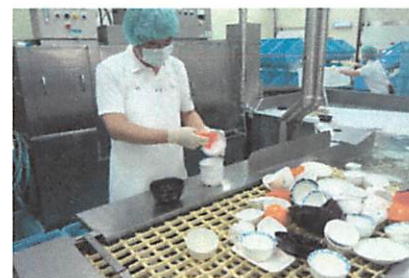
←前洗い→洗浄機セット←ピックアップ→カート洗浄